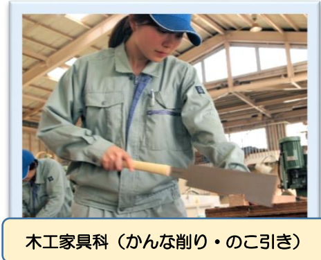
木工家具科(かんな削り・のこ引き)