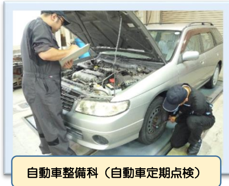
自動車整備科(自動車定期点検)