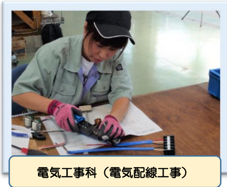
電気工事科(電気配線工事)