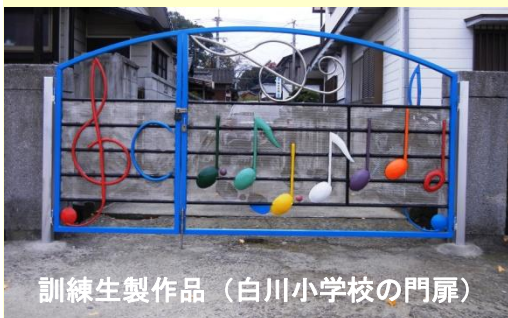
訓練生製作品 (白川小学校の門扉)