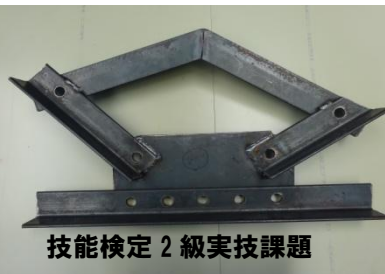
技能検定 2級実技課題