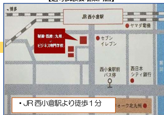
【選考試験会場案内図】

訓練内容の専門的詳細については、製菓・医療九州ビジネス専門学校(TEL:093-561-6162)へお問い合わせください。