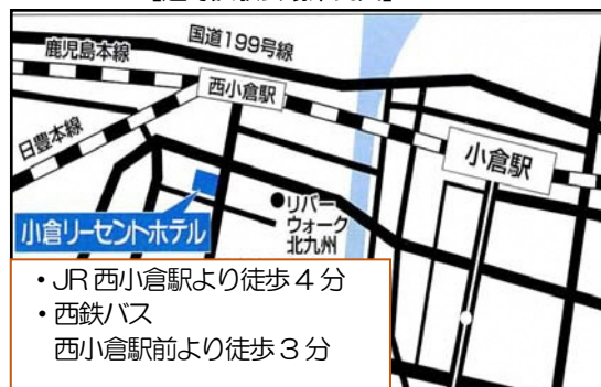
【選考試験会場案内図】

訓練内容の専門的詳細については、製菓・医療九州ビジネス専門学校(TEL:093-561-6162)へお問い合わせください。