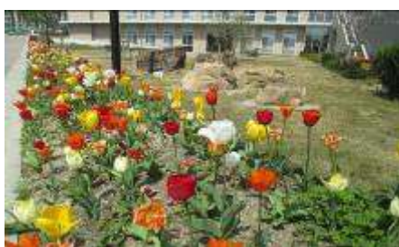
チューリップと石庭