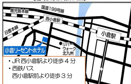
【選考試験会場案内図】

詳しくは、ハローワークまたは福岡県立戸畑高等技術専門学校(TEL:093-882-4306)へ、 訓練内容の専門的詳細については、製菓・医療九州ビジネス専門学校(TEL:093-561-6162)へお問い合わせください。