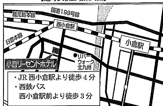
【選考試験会場案内図】

訓練内容の専門的詳細については、製菓・医療九州ビジネス専門学校(TEL:093-561-6162)へお問い合わせください。