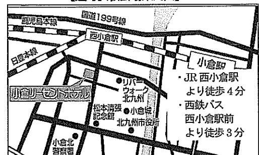
【選考試験会場案内図】