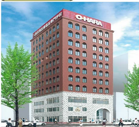
大原保育医療福祉専門学校福岡校

〒812-0026 福岡市博多区上川端町13-19 TEL 092-271-2942 URL http://fukuoka.o-hara.ac/ Eメール fukuoka@o-hara.ac.jp