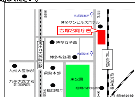
< 選考会場 >

訓練内容の詳細についてはMIJスクール福岡校（TEL:092-562-7577）へお問合せください。