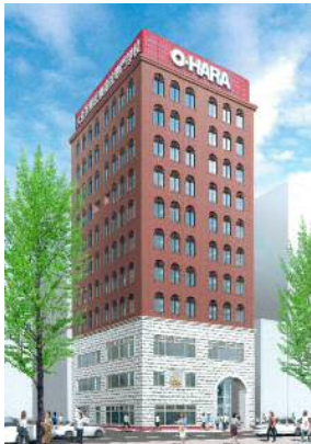
大原保育医療福祉専門学校

〒812-0026 福岡市博多区上川端町13-19 TEL 092-271-2942 URL http://fukuoka.o-hara.ac/ Eメール fukuoka@o-hara.ac.jp